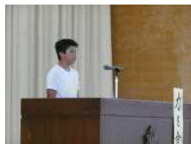
6年 児童 さん