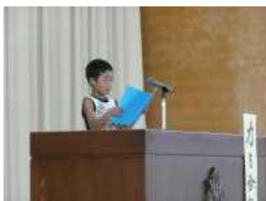
2年 児童 さん