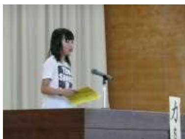
4年 児童 さん