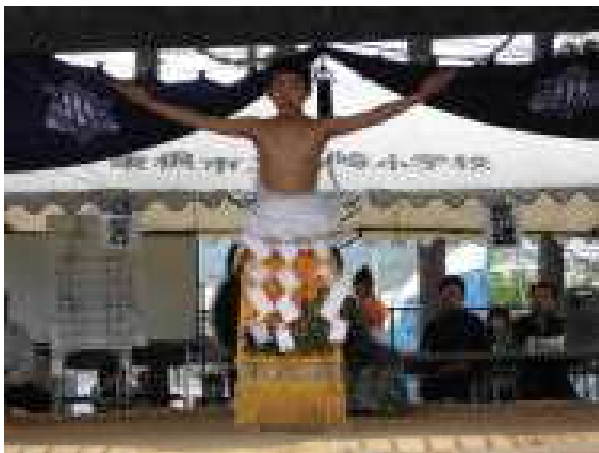
西方横綱 土俵入り (6年 男 児)