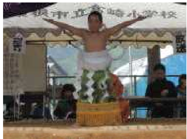
東方横綱 土俵入り (6年 男 児)