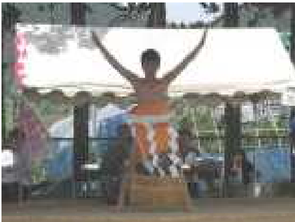
西方横綱 土俵入り (6年 男児)