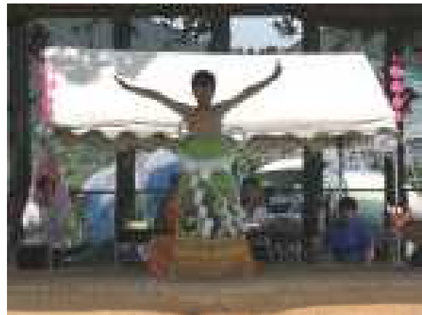
東方横綱 土俵入り (6年 男児)