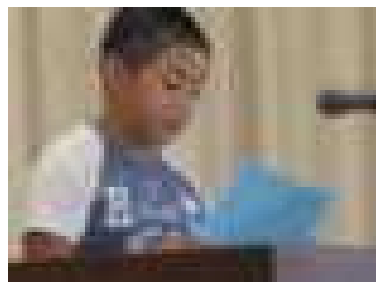
4年 男児 さん