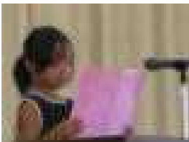
2年 女児 さん