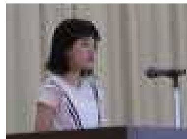
6年 女児 さん