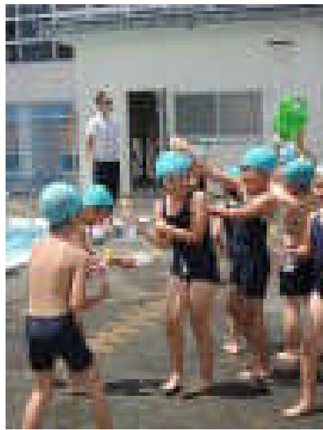
1, 2年 体育 水泳学習の練習をしました。

◆ 自由参観にも多数ご出席いただきありがとうございました。子ども達はお父さんお母さん、おじいさんやおばあさんの前で、緊張しながらも張り切って学習していました。