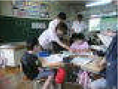
4年 国語「動いて、考えて、また動く」