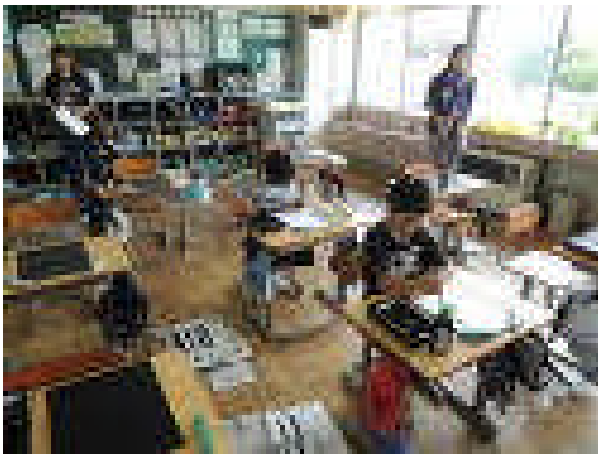
3年 書写 緊張の中で書きました。