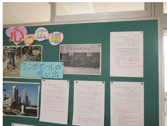
<5年生の心のコーナー>