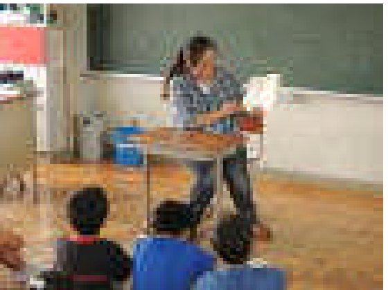
<青空カンガルーさんによる読み聞かせ>

◆ 学校では、子ども達が仲良く遊んだり、勉強したりできるように優しい心を育む活動に力を入れています。各教室には“心のコーナー”があります。日頃の小さなすばらしさを発見させています。読書も心を豊かにします。青空カンガルーさんによる読み聞かせを子ども達はとても楽しみにしています。