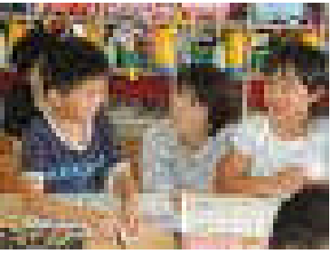
2年 国語「お話の作者になろう」