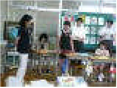
5年 道徳「シンガポールの思い出」